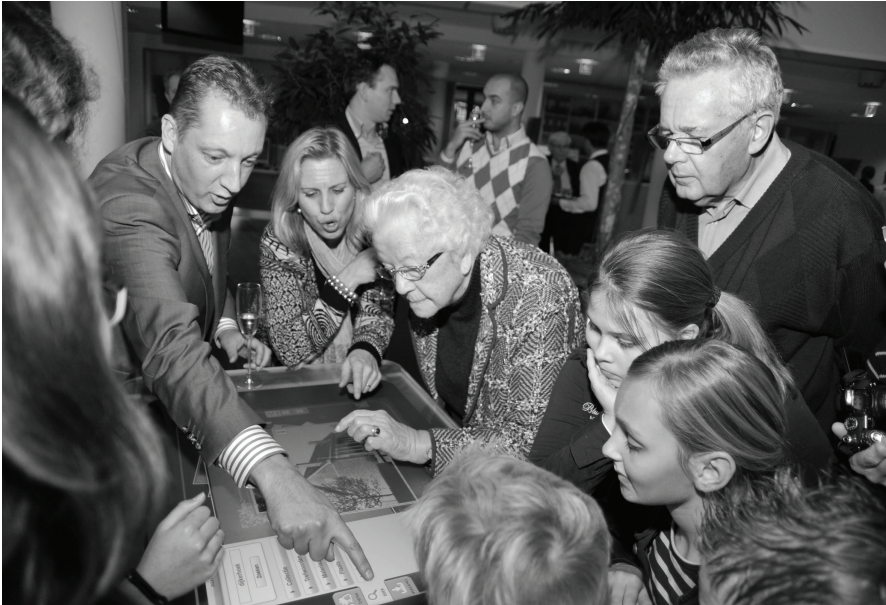
Ouderen en jongeren

zorgingsstaat. We kunnen en mogen niet verwachten dat oude samenlevingsstructuren in dezelfde vorm weer terugkeren. Er zijn gelukkig wel lichtpunten te benoemen, zoals buddyprojecten bij psychiatrische en palliatieve zorg. Ook valt de ketenaanpak toe te juichen. Hierbij treden verschillende instellingen met elkaar in overleg om een geïntegreerd traject uit te stippelen voor de aanpak van bijvoor-