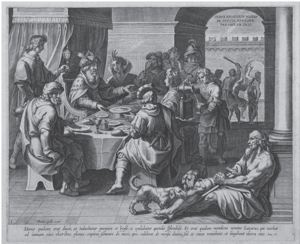
Gravure (± 1700) over de gelijkenis van de rijke man en de arme Lazarus

Lambert Pasterkamp projectmedewerker WI-SGP