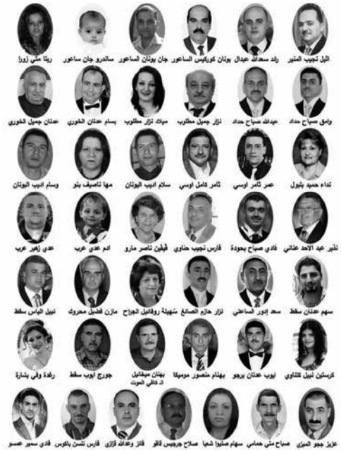
slachtoffers van een aanslag op de kerk in Baghdad Saidat Al Najat waarbij meer dan 58 mensen het leven lieten.

Het is heel erg wrang en bitter dat 100 jaar na dato in deze regio min of meer eenzelfde drama zich aan het voltrekken is. Bij veel christenen in Irak leeft daardoor de gedachte dat ze in de steek worden gelaten door de westerse wereld die zichzelf zo beschaafd vindt. Ook bekruipt hen het gevoel dat vele christenen in andere landen van de wereld