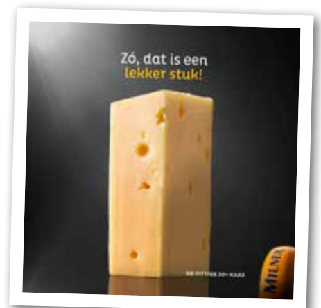
Kaasfabrikant Milner gaat de grenzen van smakelijke reclame soms ruimschoots over.

Wij noemen hen dan psychisch gestoord of schizofreen en eisen een harde aanpak. In bepaalde zin handelen zij echter consequent. Zij voegen de daad bij onze westerse beelden over vrouwen. Zij oogsten wat wij zaaien. Hun schaamteloze daden mogen niet worden goedgepraat, maar schaamte moet het gelaat van onze samenleving bedekken. ◀