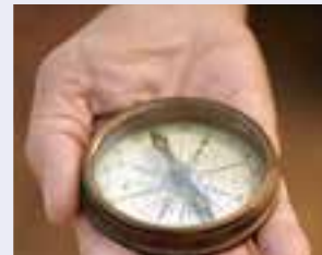
SGP Bewust geloofwaardig Handleiding voor integere politiek

Op het partijcongres komt er een antwoord op deze vragen. Ook wordt de publicatie Bewust geloofwaardig. Handleiding voor integere politiek gepresenteerd.