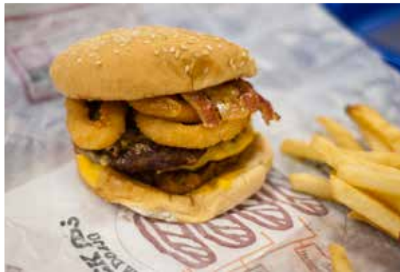
“Bij ongezond eten kan het wel!”

Maar hoe kijkt seculier Nederland hier nu tegenaan? Er blijkt vooral verwarring. Het valt mij op dat veel seculiere jongeren en ouderen er een slecht gevoel bij hebben, maar het lastig vinden hierover openlijk een afwijzend standpunt in te nemen. Moeten volwassen mensen dit eigenlijk niet zelf weten? Is het geen betutteling