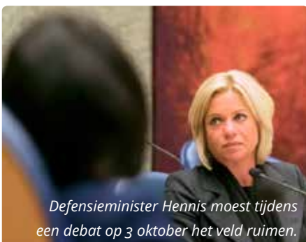
Defensie minister Hennis moest tijdens een debat op 3 oktober het veld ruimen.

Het mortierongeluk in Mali, waarbij twee militairen zijn omgekomen en één zwaargewonde is gevallen, was te ernstig om aan te kunnen blijven als minister. Ook de hoogste militair, Tom Midden-dorp, heeft zijn verantwoordelijkheid genomen en is - twee dagen vóór zijn al geplande en eervolle vertrek - met stille trom vertrokken. Minister en generaal toonden zich tot aan het einde toe strijdbaar en namen het op voor Defensie.