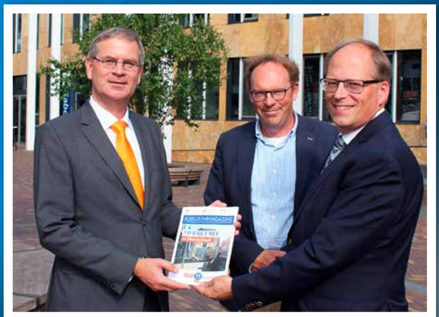
Verloop en Both ontvangen het jubileumglossy.