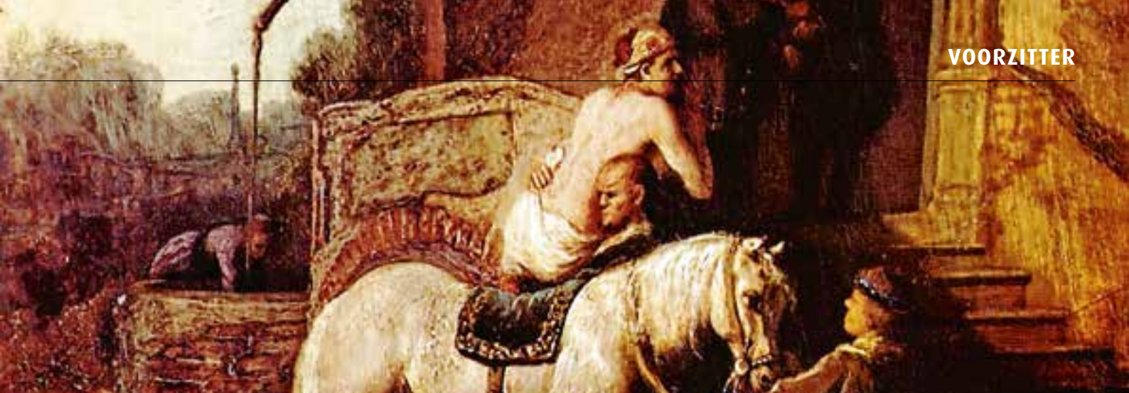
Rembrandts Barmhartige Samaritaan