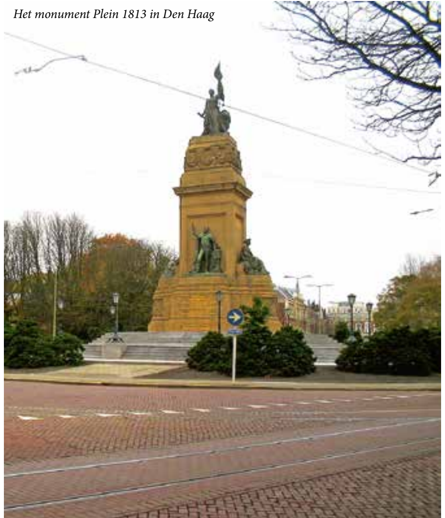
Het monument Plein 1813 in Den Haag

publieke leven verbannen wordt, toont Groen aan dat andere geesten bezit nemen van het ‘leeg verklaarde huis’. Neutraliteit bestaat immers niet. Het Nationaal Comité 200 jaar