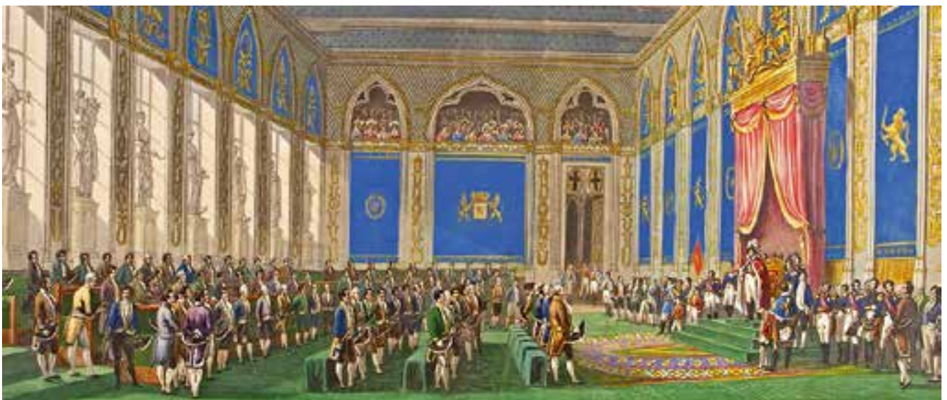
Koning Willem I wordt ingehuldigd op het Koningsplein te Brussel.

Koninkrijk dat de verschillende activiteiten naar aanleiding van de jaren 1813-1815 organiseerde en coördineerde, spreekt alleen over vieren, niet over herdenken. Hier-