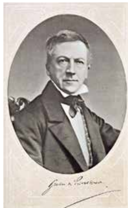
Groen van Prinsterer

Het is niet waarschijnlijk dat de renovatie van het Binnenhof anno 2015 leidt tot een dergelijk principieel debat over de betekenis van de Nederlandse politiek en geschiedenis. Hoe vaak hoor ik in Den Haag