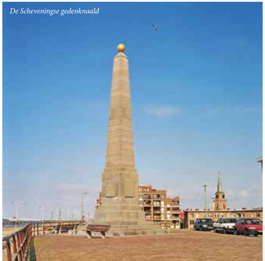
De Scheveningse gedenknaald

(natiestaat). In de 19e eeuw wordt de naam van de enige protestantse kerk verbonden met de staat: de Nederlandse hervormde kerk. Aan het eind van de 18e eeuw was het begrip 'vaderlandse kerk' voor het eerst gebruikt door de orthodoxe predikanten Johannes Barueth (1710-1782) en Petrus Hofstede (1716-1803).