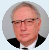
DS. A.A. EGAS Damwoude / Damwâld

Waarom schets de Heere in Zijn Woord ons zo indringend de werkelijkheid van deze eerste aarde? Omdat we diep beseffen