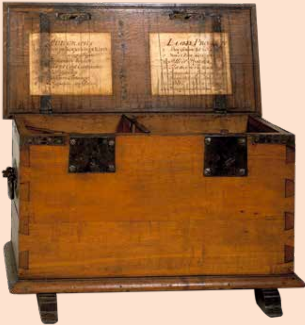
ROELOF BISSCHOP TWEDE KAMERLID

Eén van de bijzondere onderdelen van de expositie over de Statenvertaling die momenteel te zien is in het gebouw van de Tweede Kamer, is het laatste 'object'. Geen origineel stuk of kunstvoorwerp, maar een 'overschrijfbijbel', een schrijfboek met pen, en een stoel. Iedere bezoeker wordt hier uitgenodigd om in alle rust zelf een Bijbeltekst over te schrijven.