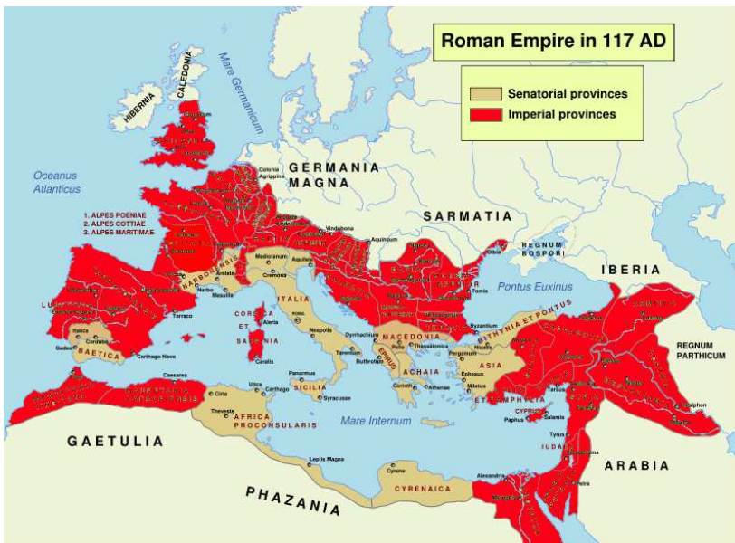
Figuur 1. De grenzen van het Romeinse rijk

gesteld en ook aan de senaat verantwoording moet afleggen. In de senaat hebben vertegenwoordigers van de belangrijkste families in Rome zitting. Tot de keizerlijke provincies behoren de provincies die rechtstreeks onder de keizer staan. Dit zijn de politiek onrustige provincies en de provincies waar de Romeinse legioenen zijn gestationeerd. 3