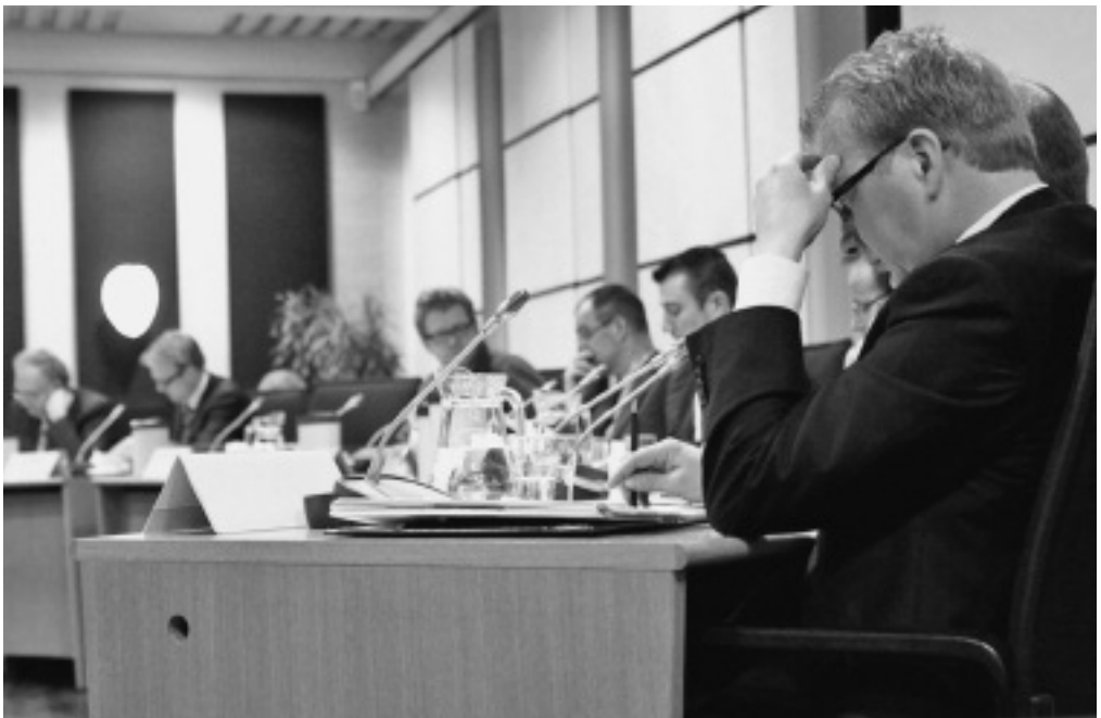
Gemeenten moeten zorgen voor een goed kennisniveau: scherpe discussies en doordachte keuzes.

Ik denk dat met de grote onderwerpen die nu op de gemeenten afkomen het onderscheidend vermogen in potentie toeneemt. Ik denk dat dat in deze campagne overigens nog geen grote rol speelt, maar dat komt wel. De oriëntatie van de gemeenteraad zal