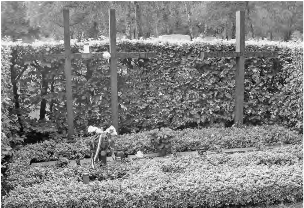
De graven van Hans en Sophie Schöll en Christoph Probst.

universiteitsgebouw. De nazi’s vinden bij Hans de handgeschreven conceptversie voor een zevende pamflet. Auteur: Christoph Probst. Een dag later worden Christoph en Willi gearresteerd en binnen een maand ook Alexander en professor Huber. Hans, Sophie en Christoph worden op 22 februari veroordeeld en geëxecuteerd door middel van de guillotine. In juli en september worden ook de andere gearresteerde leden van de verzetsgroep op deze wijze om het leven gebracht. Tegenover de Gestapo verklaart Sophie dat zij het nationaal-socialisme principieel afwijst omdat ‘naar mijn opvatting de geestelijke vrijheid van de mens op een manier wordt beknot, die mijn binnenste tegenspreekt.’ Sophie sluit haar verhoor af met de woorden: ‘Ik ben nog steeds van mening dat ik het