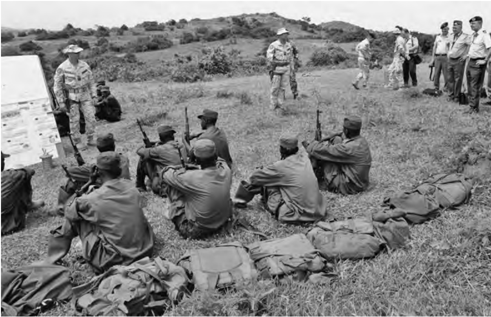
Luitenant-generaal Van Osch (geheel rechts boven) op bezoek bij de EU Trainingsmissie voor Somalië (2011).