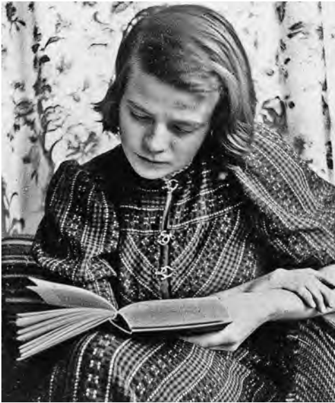
Sophie Scholl, een boekenwurm...

beste gedaan heb, wat ik voor mijn volk kon doen. Ik heb geen spijt van mijn handelen en zal de gevolgen daarvan volledig op mij nemen.' Om vijf uur 's middags wordt het doodvonnis voltrokken. Sophie sterft rustig en kalm, zo staat in het protocol geschreven. Twee minuten later wordt haar broer omgebracht. Vlak voordat de valbijl wordt losgelaten, roept Hans luid: 'Es lebe die Freiheit!' 1