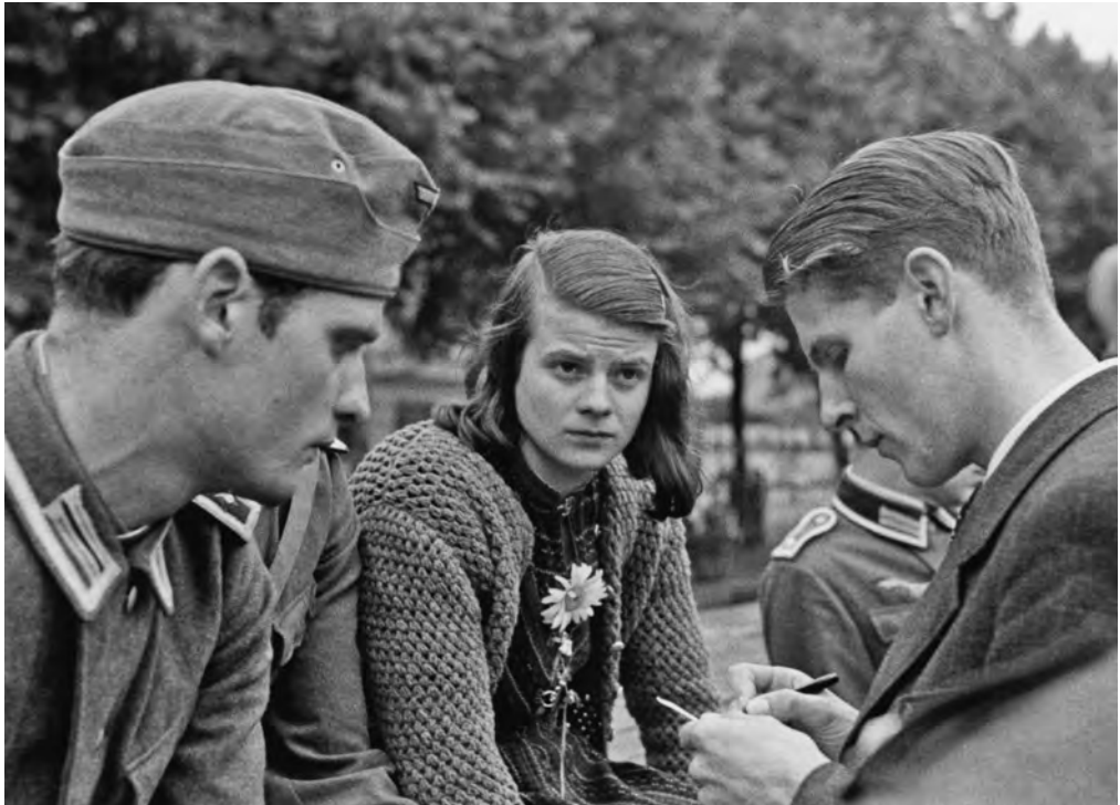
Van links naar rechts: Hans Scholl, Sophie Scholl en Christoph Probst.